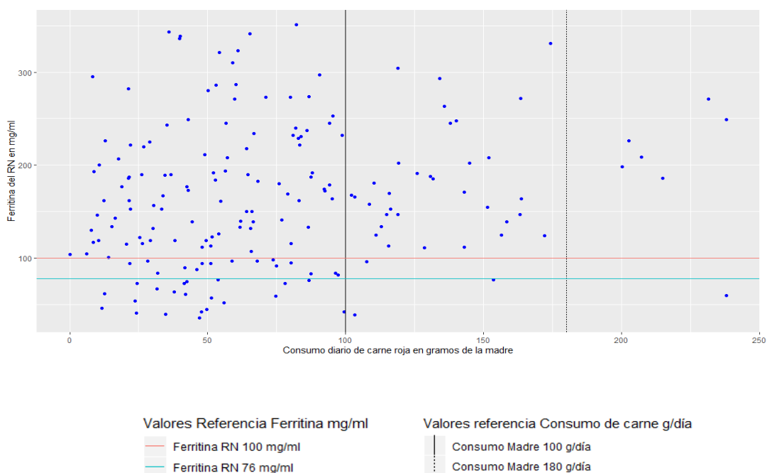
Gráfica 2. Consumo de carne materno y niveles de ferritina de cordón umbilical <100ng/ml

El consumo de carne por debajo de los 100 gramos por día durante la gestación aumentó el riesgo de forma significativa de presentar déficit de ferritina al nacimiento (Gráfica 2) por debajo de 100 ng/ml (OR 3,47 [IC 95%, 1,28 – 12,17]) Tabla 7.