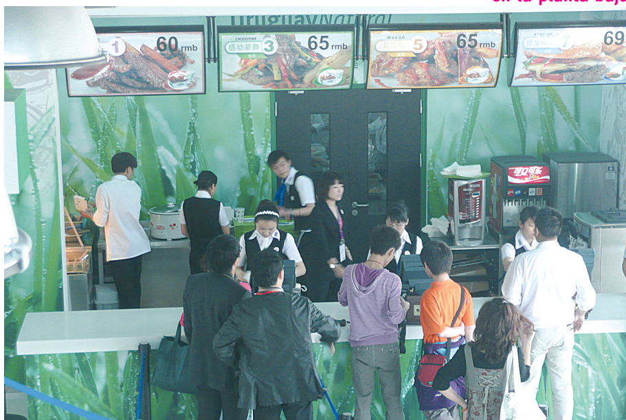
Comida rápida en la planta baja