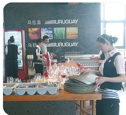
Restaurante de planta alta

Esperamos que las personas se retiren habiendo conocido “algo” sobre nuestro país y sus carnes naturales, que pueden adaptarse a diversas etnias culinarias, logrando la fusión de culturas. En el menú se encuentran platos con nombres de nuestros más bellos lugares y tradiciones.