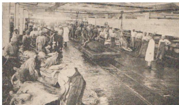
Frigorífico de principios del siglo XX